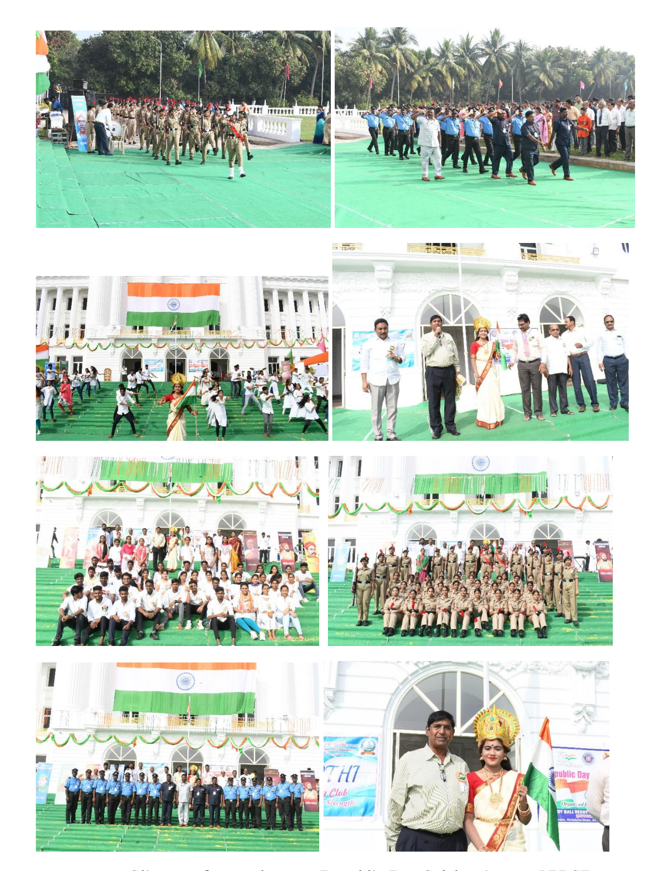
Glimpse of snap shots on Republic Day Celebrations at LBRCE